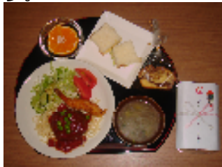
ご利用者より頂いたお言葉